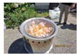
非常食炊き出し訓練