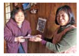
地域高齢者生活支援事業

活動資金のご協力は日赤志布志市地区(志布志市社会福祉協議会本所・各支所)にて受け付けております。