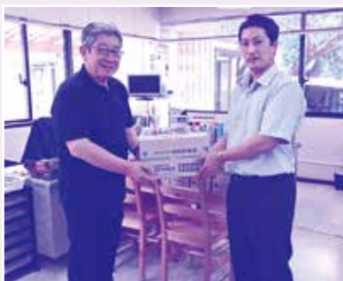
社会福祉法人欣生会 小松の里様

社会福祉法人欣生会様、社会福祉法人きりたけ福祉会様より、社会福祉法人の地域における公益的な取組みの一環として、食料等をご提供いただきました。これらは生活にお困りの方への支援として活用させていただきます。