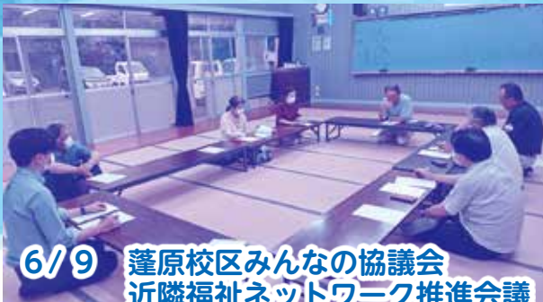
6/9 蓬原校区みんなの協議会 近隣福祉ネットワーク推進会議