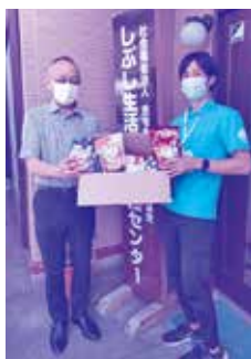
～フードバンクしづし 子ども食堂様からの提供～

しづし生活自立支援センター「ひまわり」では、市委託事業により生活困窮者等の支援を行っています。生活困窮者支援の一環として食料支援等しており、市民の皆さまや団体の方々より食料品や日用品等の提供を受け、支援を必要とする方へお届けしています。