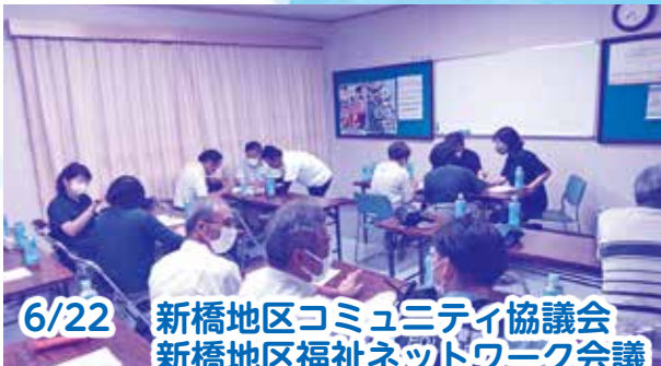
6/22 新橋地区コミュニティ協議会 新橋地区福祉ネットワーク会議