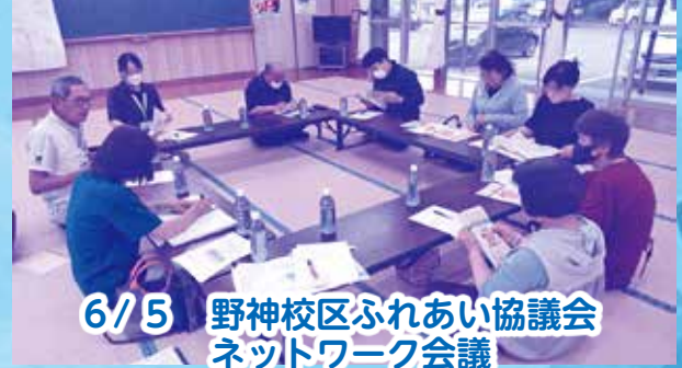
6/5 野神校区ふれあい協議会 ネットワーク会議