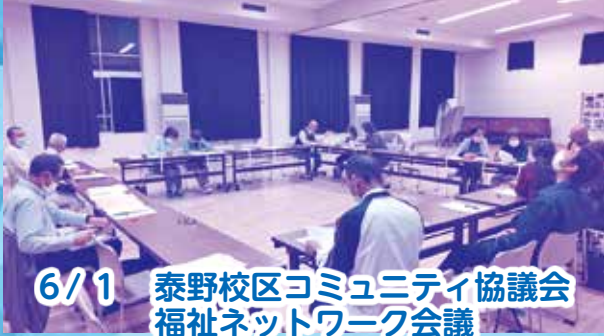
6/1 泰野校区コミュニティ協議会 福祉ネットワーク会議