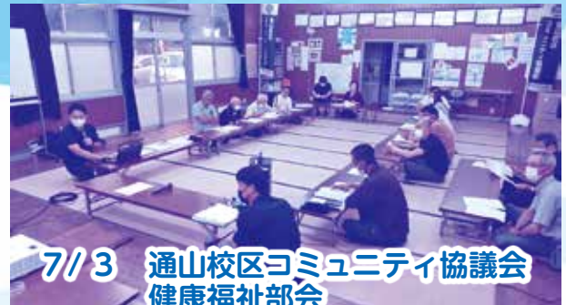
7/3 通山校区コミュニティ協議会 健康福祉部会