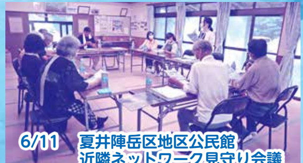
6/11 夏井陣岳区地区公民館 近隣ネットワーク見守り会議