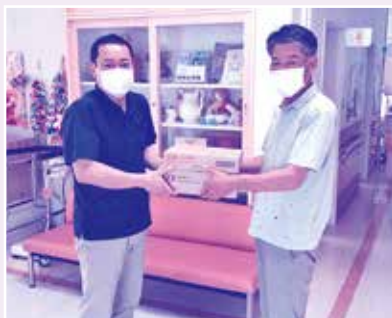
社会福祉法人きりたけ福祉会 あけぼの園様