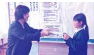
野神小学校 小島校長先生より 認定証の授与