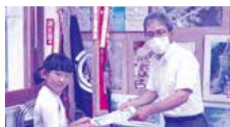
尾野見小学校 宗岡校長先生より 認定証いただきました