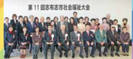
志布志市社会福祉協議会会長表彰を受けた皆さま

※本大会での被表彰者を紹介いたします。(敬称略) ① 志布志市社会福祉協議会会長表彰 民生委員児童委員として、8年以上その職務に従事し、功績があつて、現に在職している者