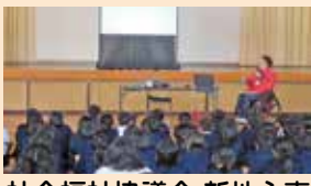
社会福祉協議会 新地主事 による人権講話