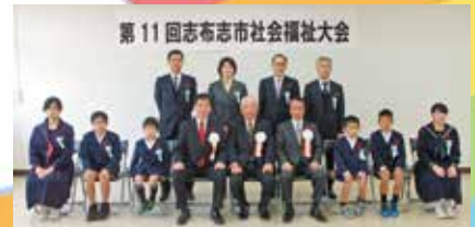
福祉作文・絵画コンクールにて表彰を受けた皆さま