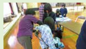
パジャマの着脱体験