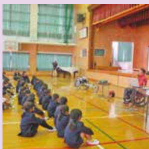
社会福祉協議会 新地主事による人権講話