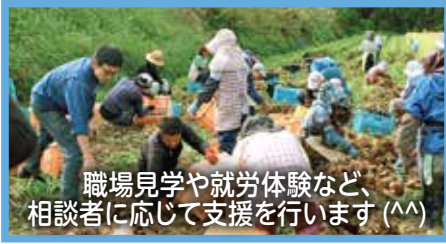
職場見学や就労体験など、相談者に応じて支援を行います (^^)