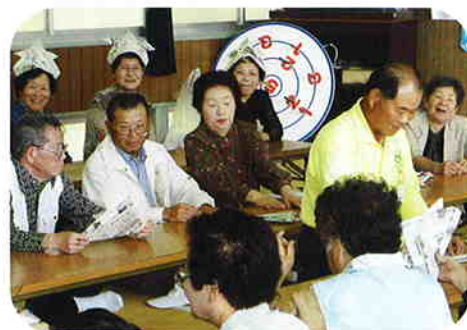
カブト作りに挑戦!

く進められました。男性の会員は「ただ一人で『兜づくりを孫と予習をしたのだが』と断って、材料の新聞紙を配り、作り方をリードしていました。」