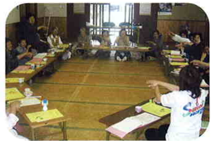
サロンへおじゃったもんせ!

最後に夏井地区の会長さんが「交流を深め、地域の輪を広めていきたい。」と話されました。