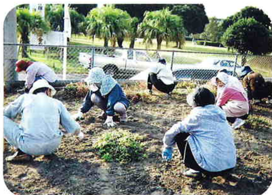
アピア花園にて。花植えの下準備をしました

私たちの活動は、まだ花の開かないつぼみですが、明るい活力ある長寿社会を目指して、高齢者の生きがいづくりに頑張っています。