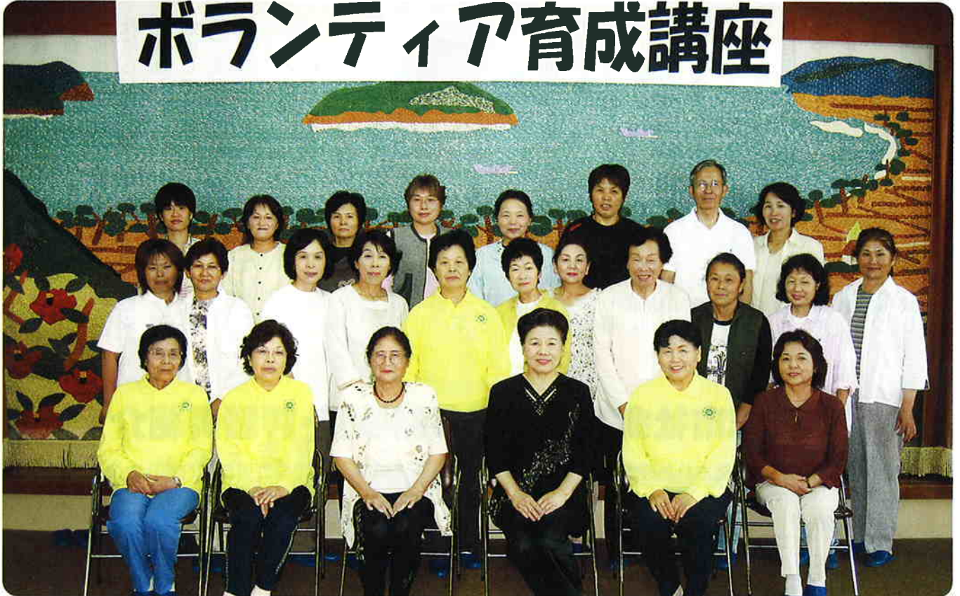
志布志市民センターにて