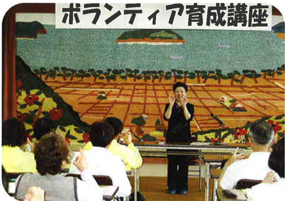
「もしもしかめよかめさんよ♪」