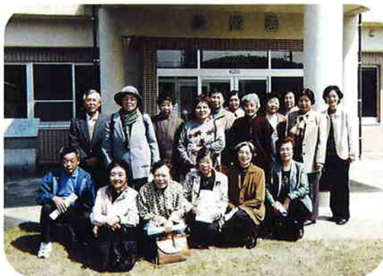
長遊園を訪問しました