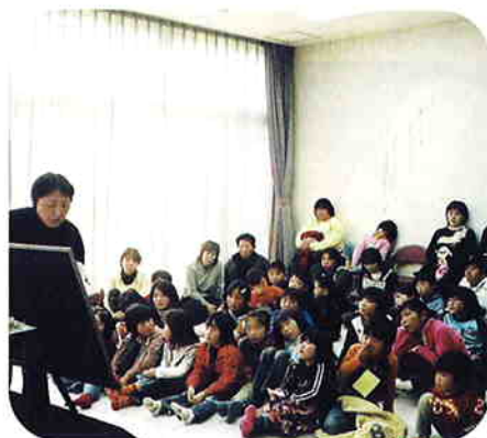
絵本の読み聞かせをしている様子