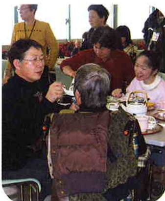
大勢で食べるごはんはおいしいね。

視覚障害の方も飛行機のエンジン音を間近に聴き、感動されているのが伝わってきました。