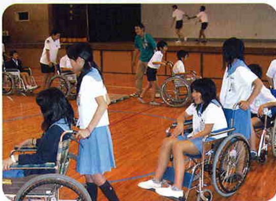
介助講習会の開催 (志布志小学校にて 2006.5)

地区社協が地域の福祉活動の柔軟なネットワークの場として、関係機関と連携し、中心的な役割を果たすように支援します。また、福祉のまちづくりを推進するため、次世代を担う子ども達に対する福祉教育推進に努めます。