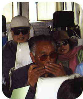
道中も楽しい車内でした。

帰路のマイクロバスの中では、参加者のハーモニカ伴奏で皆で唄を歌い、和気あいあいと参加者同士の交流も深まりました。