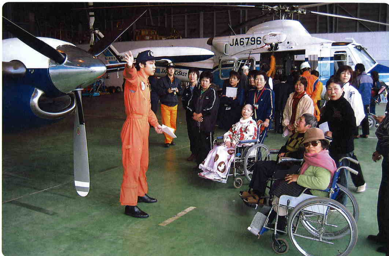
第10管区海上保安部鹿児島航空基地にて

社会福祉法人 発行 志布志市社会福祉協議会 志布志市志布志町志布志3222-1 (志布志市健康ふれあいプラザ内) TEL: 472-1800 FAX: 472-1593