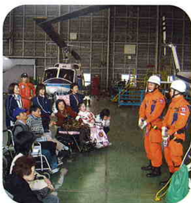
数日前にまぐろ漁船遭難者を救助!

また、通称「海猿」と呼ばれる潜水士の方が訓練の様子を実演して下さり、確認時の大きな声などから張り詰めた緊張感を感じることができ、とても有意義な時間を過ごせました。