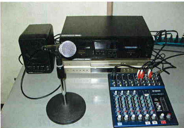
こちらを使って録音をします！

サービスを受けられる対象者は志布志市にお住まいで、高齢や視覚障害などにより文字が読みにくく、不