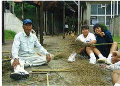
ヤッター！出来上がり！

ほうきの穂を束ねる作業では、硬い竹の枝を相手に四苦八苦していた生徒も、出来上がった「竹ぼうき」に大満足のようでした。 沢山作られたほうきのおかげで、中学校もなお一層きれいになる事でしょう。