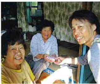
渡して笑顔、貰って笑顔。