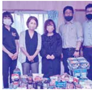
志布志市商工会女性部の 皆さまより、食料品や 日用品などをいただきました。

家庭菜園で採れた野菜やボランティア団体等からの寄附など、多くの皆さまにご協力をいただいております。