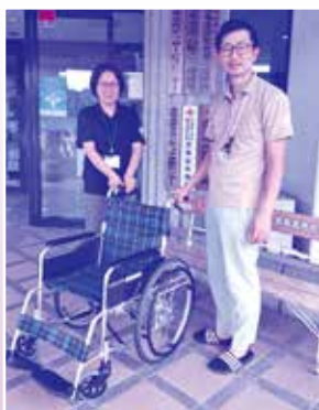
車いす1台 鹿児島県タクシー協会様