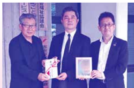
株式会社谷口海産より、みやぎんCSR型私募債を活用した寄附金贈呈