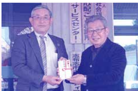
そお鹿児島農業協同組合組合長より、ゴルフ大会チャリティー寄附金