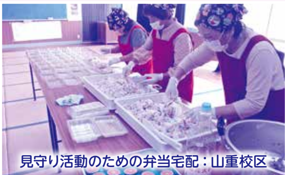
見守り活動のための弁当宅配：山重校区

本年も10月1日より、「赤い羽根共同募金運動」が全国一斉に展開されております。皆さまから寄せいただいた共同募金は、志布志市内の子どもたちや高齢者、障がいのある方などを支援する様々な活動や災害時支援等幅広く活用されております。皆さまの温かい善意をよろしくお願いいたします