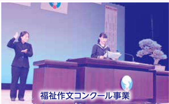
福祉作文コンクール事業