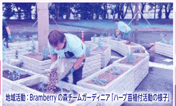
地域活動：Bramberryの森チームガーデニア「ハーブ苗植付活動の様子」