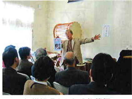
施設説明をされる施設長

開所が平成十八年四月と、まだ一年経っていませんが、利用者の活き活きとした姿を目にして、「働くことに生きがいと喜びを持ち、楽しんで一日を過ごされているのだな」と思いました。施設長が園の説明をして下さり、ボランティア代表の有意義