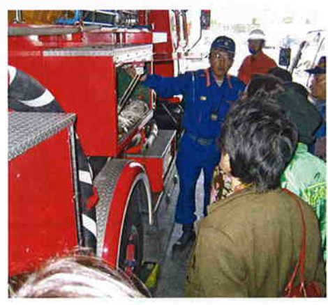
へー、こうなってるの～！

間近で見る事のない救急車・消防車の内部・器具の説明をして頂き、初めて目にする器材にボランティアの方は興味津々で質問攻めでした。