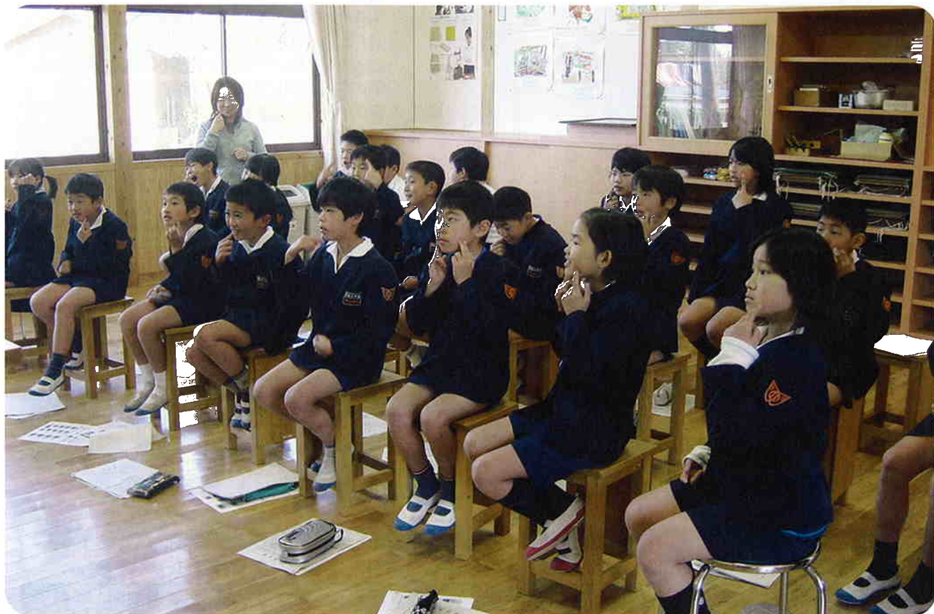
「ひとさし指を片方の頬にあてる手話は“家族”を表します」(関連記事P6)

発行 志布志市社会福祉協議会 志布志市志布志町志布志3222-1(志布志健康ふれあいプラザ内) TEL: 472-1800 FAX: 472-1593