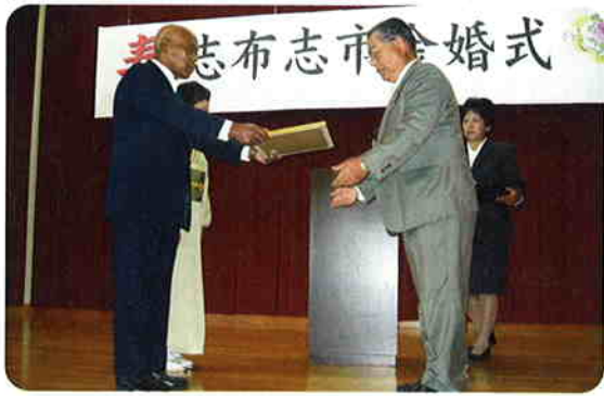
代表者へ祝詞・記念品贈呈