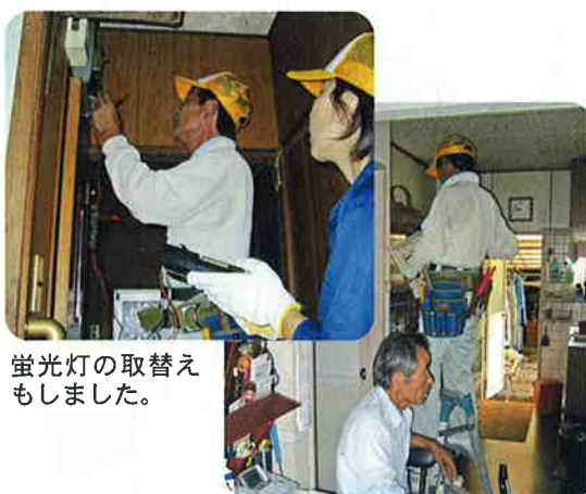
蛍光灯の取替えもしました。

九月八日(金)、志布志市内に居住される白寿、一〇〇歳以上の高齢者等を対象に敬老訪問を実施しました。白寿の方十名、一〇〇歳以上の方十二名に記念品をそれぞれ贈呈いたしました。訪問先では、皆様の笑顔に接し、ともに長寿をお祝いしました。これからも健康に留意され、元気に過ごして下さい。