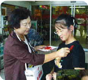
赤い羽根を付けています。