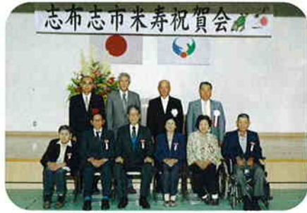
有明町の皆さん(6名)