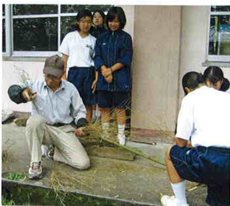
結構、技術がいらいます。

九月二十一日(木)、松山中学校の一年生四十名が、総合学習の時間を利用し「竹ぼうき作り」をしました。