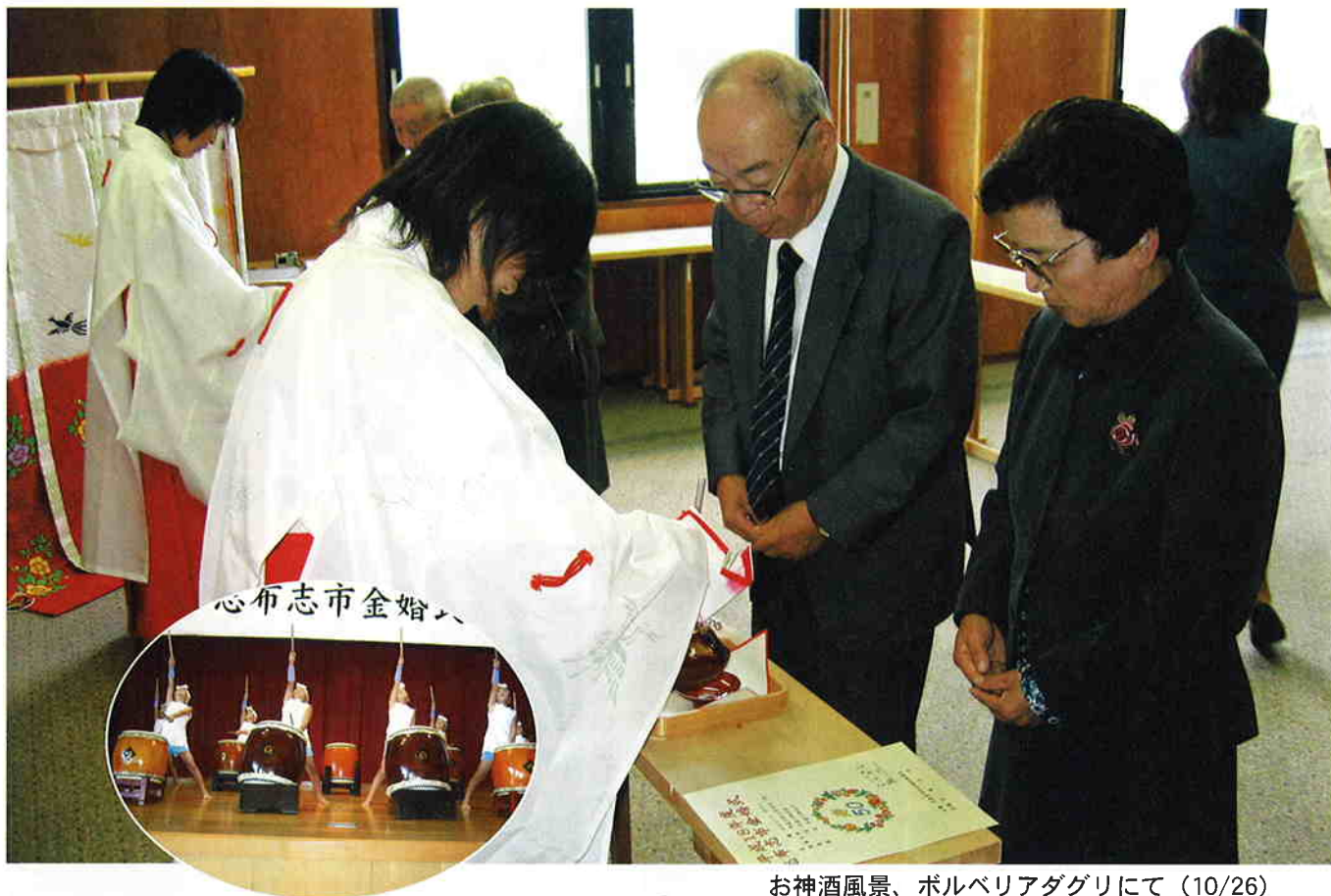
お神酒風景、ホルベリアダグリにて (10/26)

発行 志布志市社会福祉協議会 志布志市志布志町志布志3222-1 (志布志健康ふれあいプラザ内) TEL: 472-1800 FAX: 472-1593