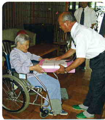
これからもお元気で。