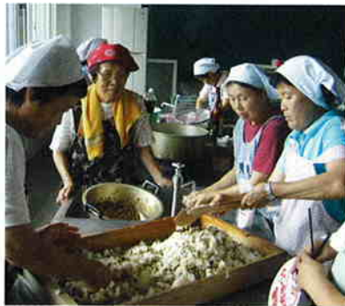
もう少しして できあがるよ～!

去る九月三日(日)、松山町の泰野地区公民館で、「ひとり暮らしの集い」が開催され、十六名の参加者がありました。