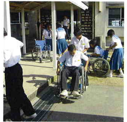
段差で立往生する生徒たち

また、高齢者の疑似体験では、実際に高齢者体験道具(もみじ箱)を身につけて、腰が曲がったり白内障等で視野が狭くなったりする体験をしました。