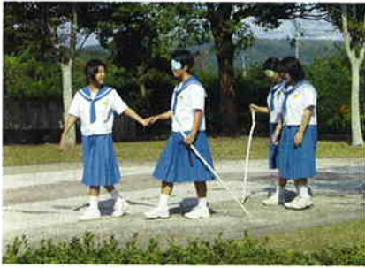
「大丈夫」と言われても怖いなあ

今回は、有明町の宇都中学校一年生・五十六名が福祉体験学習ということので、障害者と高齢者の立場を体験し、どのように接したら良いか、どのように介助すべきかの体験学習をしました。アイマスクでは、介助者の早めの誘導・声かけが大事であることを知り、車椅子では階段を四人で抱えて移動する体験をして、階段一段の高さを痛感したようでした。