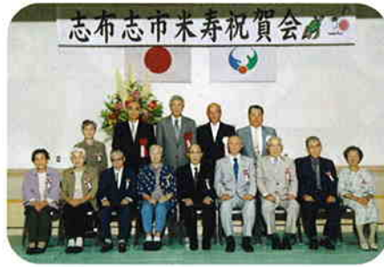
志布志町の皆さん(10名)